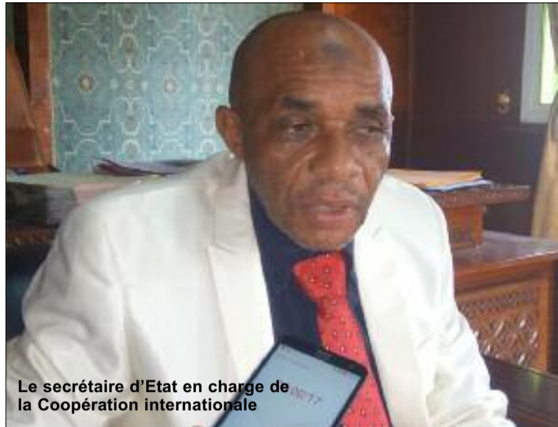
Le secrétaire d'Etat en charge de la Coopération internationale

Ce mardi 2 avril 2019, la section administrative de la Cour suprême vient, à son tour, rendre publics, les résultats définitifs du scrutin conformément à la constitution de l'Union des Comores.