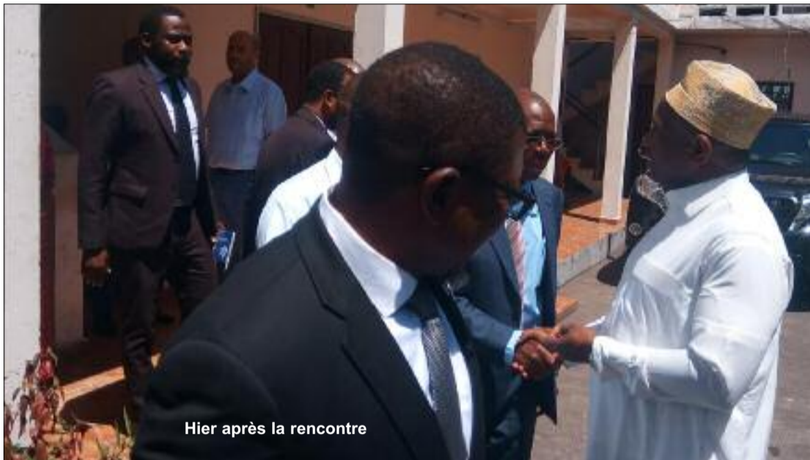
Hier après la rencontre